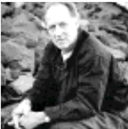
Il regista Werner Herzog

L'autore è un uomo solitario, amante dell'impresa titanica: sempre al massimo